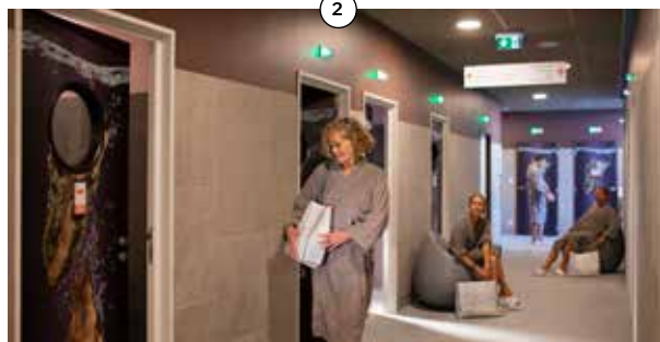
Établissement thermal premium