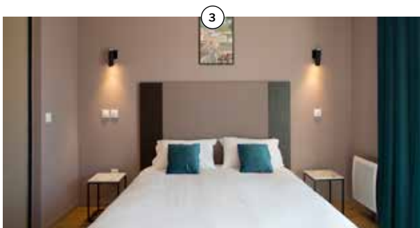
Résidence**** (1) directement reliée à vos espaces de soins